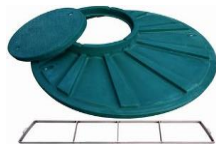
příplatekové pochozí víko